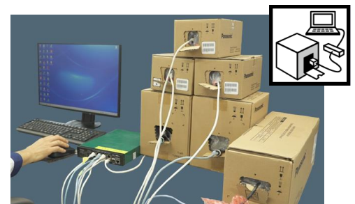
<箱からカメラを取り出さずに初期セットアップ>

設置前の事前設定などの際、カメラ本体を梱包から出すことなく、梱包側面からネットワークケーブルを差し込み、ネットワーク環境などの事前設定を行うことが可能です。また、バリフォーカルレンズモデルには電動ズーム機能を搭載しており、設置現場での画角、焦点の調整をパソコンや当社製ネットワークディスクレコーダーから行うことができるため、作業にかかる手間、時間を大幅に削減可能です。