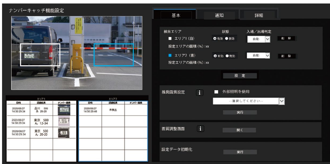
カメラ設定・調整画面イメージ。検知エリアを 2 つまで設定可能。

NumberCATCH II では、拡張ソフトウェア(WV-XAE202W)をインストールした AI ネットワークカメラ単体で車両ナンバーを読み取ってデータ化します。図柄やアルファベット文字が含まれる車両ナンバーの認識にも対応し、ナンバー認識に最適なモードで高精度な認識を行います。また最大 2 つまで検知エリアを設定して、ナンバー認識が可能です。赤外線投光器を併用することで、照度ゼロの環境でも車両ナンバーを認識し、データ化することが可能です。 * ナンバープレートは、4 輪自動車のナンバーに対応。二輪、特殊プレート（外交官ナンバー/自衛隊ナンバー/仮ナンバー/皇族車両用のナンバーなど）は非対応です。