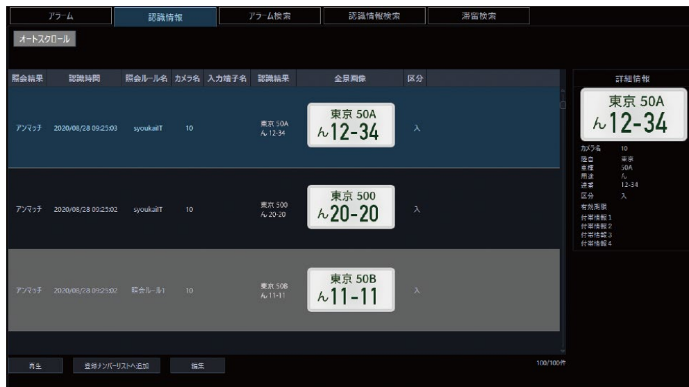
運用画面のイメージ。ナンバー情報のデータ、照合結果が画面に表示