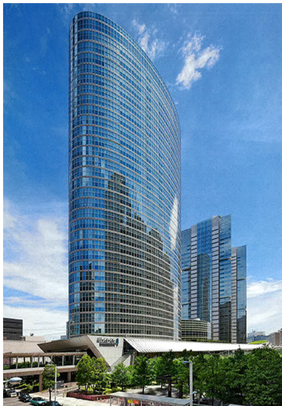
品川インターシティ A 棟 外観写真イメージ

グローバルなコミュニケーション、そして創発を生むオープンコラボレーションのための中核的な拠点。先進的・創造的なワークスペースやショールームをハブとしたお客様との新たな接触ポイント。