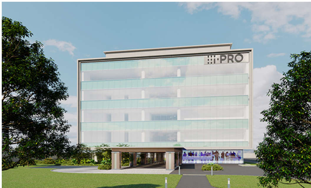
i-PRO ビルディング 外観 CG イメージ

「i-PRO Park」をコンセプトに、先進技術をお客様にも体験していただけるよう工夫した、技術開発とものづくりのオープンな仕事場。